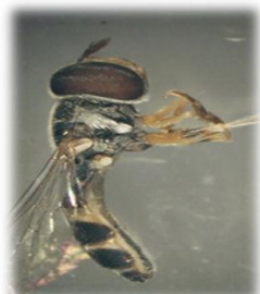
Paragus albifrons (m)