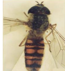
Episyrphus balteatus (e)