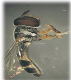
Paragus albifrons (m)