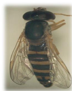
Sphaerophoria turkmenica (c)