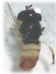
Paragus quadrifasciatus (h)