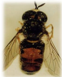
Paragus bicolor (g)