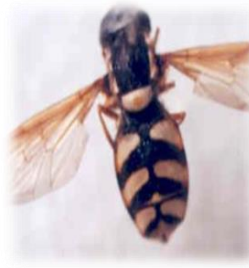
Chrysotoxum bactrianum (n)