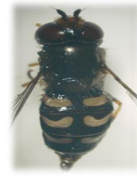
Scaeva dignota (i)