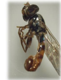
Sphaerophoria rueppelli (l)