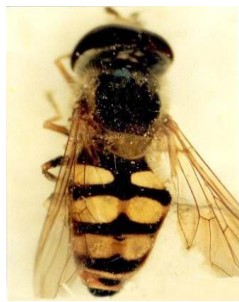
Eupeodes corollae (a)