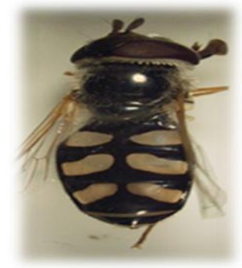
Scaeva albomaculata (o)