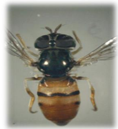
Paragus compeditus (j)