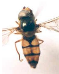
Eupeodes nuba (b)