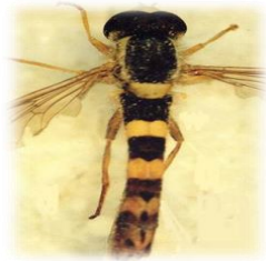
Sphaerophoria scripta (d)