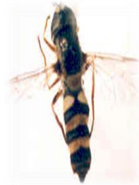
Ischidon aegyptius (k)