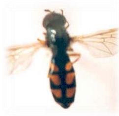
Melanostoma millenium (f)