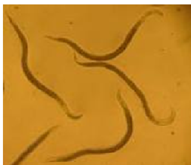
شکل ۱- لارو سن سوم S. feltiae .