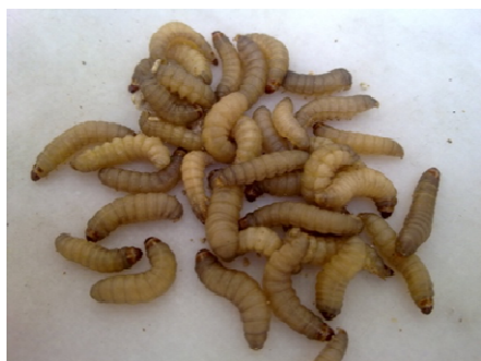
شکل ۲- لارو سن آخر پروانه ی موم خوار G. mellonella .

واژه های کلیدی: شب پره ی مینوز، گوجه فرنگی، کنترل بیولوژیک، نماتد انگل حشرات