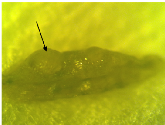
شکل ۴- شب پرهی مینوز آلوده به S. feltiae .