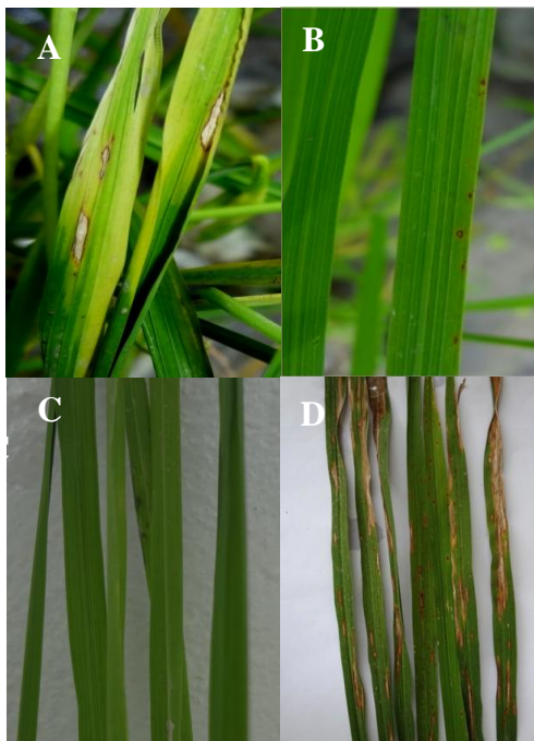
شکل ۲- کنترل بیماری بلاست برگ برنج (رقم طارم محلی) توسط جدایه‌های تریکودرما در گلخانه. کاهش علائم بیماری پس از محلول پاشی سوسپانسیون کنیدی‌های جدایه‌ی Trichoderma harzianum RS6-7 (A)، جدایه‌ی T. harzianum RP8-4 (B) و جدایه‌ی T. harzianum RP1-6 (C). (D) تیمار شاهد آلوده.